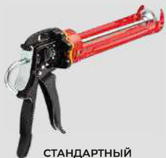
СТАНДАРТНЫЙ ПИСТОЛЕТ (объем баллона 300 мл)