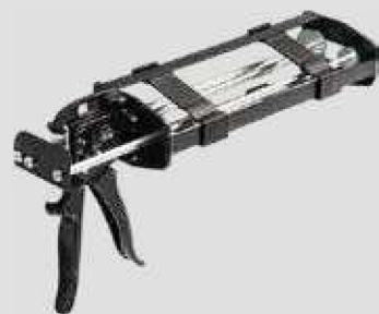
ПИСТОЛЕТ ДЛЯ ДВУХКОМПОНЕНТ- НОГО ХИМИЧЕСКОГО АНКЕРА (объем баллона 385/585 мл)