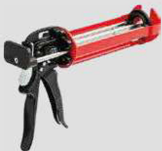
ПИСТОЛЕТ ДЛЯ ДВУХКОМПОНЕНТ- НОГО ХИМИЧЕСКОГО АНКЕРА (объем баллона 400 мл)